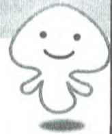
マスコット キャラクター 菌糸くん