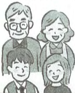
家族みんなの健康が一番です!

体が常に正しい処理ができるように免疫力をしっかりしておくことが日々健康で長生きできる近道ではないでしょうか。